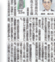
愛媛新聞など3紙で報道された 森田こうじ 愛媛県本部参院選挙区代表