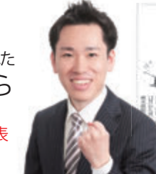
愛媛新聞など3紙で報道された 森田こうじ 愛媛県本部参院選挙区代表