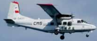
領空侵犯して飛行する中国機（12月13日）

衆院選のさなかという政治的空白を突くかのように、2012年12月12日、北朝鮮が「人工衛星」と称し、長距離弾道ミサイルの発射実験を行いました。ミサイルは米本土を射程に収めつつあり、北朝鮮が核弾頭の小型化に成功すれば、恫喝外交をエスカレートさせることは火を見るより明かです。