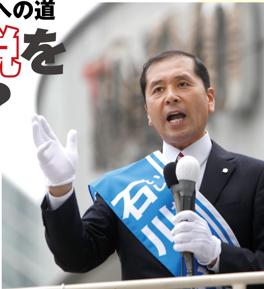
参院選がスタートし、力強い言葉で第一声をあげる石川悦男党首。

民主党政権の是非を問う参院選（7月11日投開票）が、6月24日に公示された。幸福実現党は比例代表と選挙区に計24人の候補者を擁立。石川悦男党首を先頭に、菅直人首相が掲げる「最小不幸社会」という名の社会主義政策に「NO!」を突きつけ、「最大幸福社会」の実現を目指す。「打倒・民主党政権」を訴える石川党首に参院選への意気込みを聞いた。