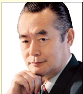
特別代表 ドクター・中松 (82歳)

【出身】栃木県 【学歴】早稲田大学法学部卒業 【経歴】野村証券(株) / (宗) 幸福の科学理事長 幸福実現党の目指す新しい国は、「夢のある国」です。そのためにも、積極的公共投資や金融緩和、大胆な減税などの経済政策で企業を元気にし、国民を豊かにしていきます。日本の高い技術力を生かして防衛力を高め、「自分の国は自分で守る」という気概で、大切な国民と領土を守り抜き、「最大幸福社会」を築いてまいります。