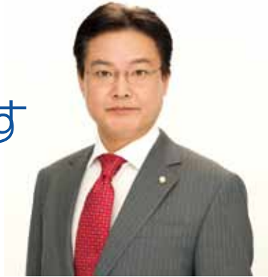
幸福実現党 党首 ひっしょう やない筆勝

近隣国の軍事的脅威、デフレ下での消費増税、少子高齢化に伴い肥大化する社会保障費——。日本を覆う閉塞感を打破するには、新たな国家ビジョン、責任ある政治の確立が必要です。幸福実現党は先見性と実効性ある政策で、日本の未来を開きます。