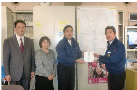
岩手県に義援金 1,000 万を寄付