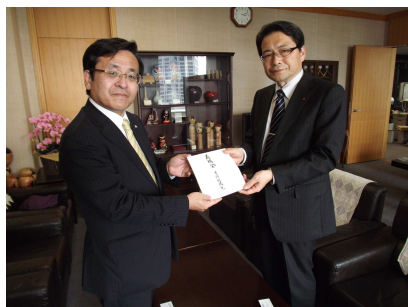
宮城県に義援金 1,000 万を寄付

幸福実現党は、今回の「東北地方・太平洋沖地震」並びに「大津波」の被災者を救援するため「地震対策本部」を発足させ、ホームページ上にて、また街頭にて「東北地方・太平洋沖地震、津波災害義援金」を呼びかけてまいりました。