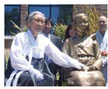
米カリフォルニア州グレンデール市に建てられた従軍慰安婦像。在米韓国系団体の主導により、全米各地に同様のモニュメント設置が進められようとしている。

また、大東亜戦争を日本の侵略戦争とする見方はあまりに一方的にすぎます。欧米列強による人種的偏見に基づいた植民地支配に対して敢然と立ち上がり、アジア解放の戦いを