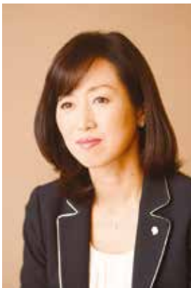
幸福実現党 党首 しやく りょう こ 釈 量子

社会保障の充実を理由に断行された今回の消費増税ですが、長い目で見て、日本経済の息の根を止めることは間違いありません。私たちは「民間の自由な経済活動が、日本の繁栄を牽引する」と考えます。新たな基幹産業の育成により、雇用の拡大と賃金アップを図ってこそ、若い世代は安心して結婚し、子供を生み育てることもできます。来年10月には消費税率の10%への引き上げが予定されていますが、これは何としても阻止しなければなりません。