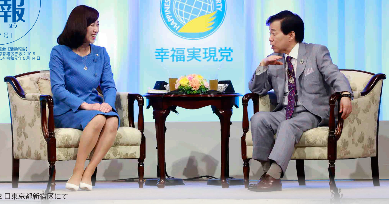
2019年5月22日東京都新宿区にて