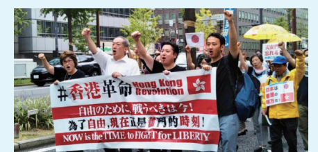
昨年9月に東京、大阪、広島、名古屋「香港革命支援デモ」を行った