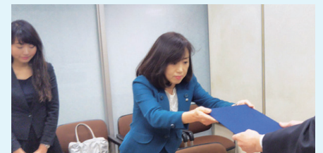
昨年11月、内閣府に香港の『自由』と『民主主義』を守る行動を求める要望書を提出