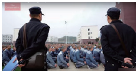
収容所で監視下におかれるウイグル人