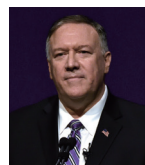
ポンペオ國務長官