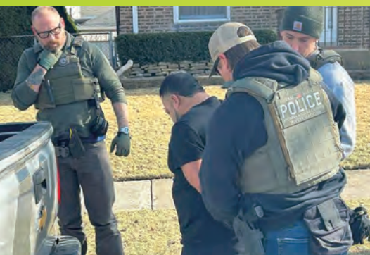
トランプ政権が取り組む不法移民の取り締まり

欧米で混乱を生んでいる“移民問題”は、元をたどれば人権の観点で移民や難民を大量に受け入れてきたことが発端であり、日本の外国人問題とは性質が異なります。特にトランプ政権が厳しく取り締まっているのは不法移民であり、背景には麻薬の蔓延といった深刻な問題があります。一方、日本の在留外国人の98%以上は仕事や就学を目的に正式な手続きを経て入国しています。もちろん、埼玉県川口市の一部のクルド人(制度を悪用した偽装難民)のような不法滞在者には厳格な取り締まりが必要です。しかし一般的な外国人問題と混同すべきではありません。