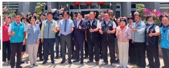
幸福実現党の活動 街宣活動(写真左)、要望書の提出(写真中)、地方議員の台湾訪問(写真右)