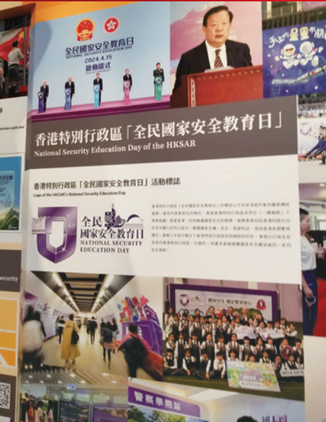
香港では国安法の施行後、教育制度見直しの一環として学校のカリキュラムに「全民国家安全教育日」が導入された

香港では“反政府的な動き”を取り締まる国安法の制定から約6年が経ちました。以降、民主派への弾圧が強まり、国安法による逮捕者は300人を超えています。今年2月には香港の裁判所が民主派新聞の創業者ジミー・ライ氏に対して懲役20年の判決を下しました。AI監視システムも広がり、多くの住民は恐怖に支配されています。