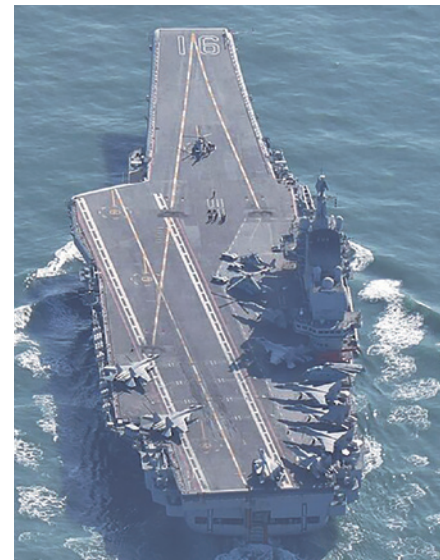
2026年4月20日に台湾海峡を通過した中国海軍の空母「遼寧」

台湾の頼清徳総統は4月、予定していたエスワティニ訪問を延期しました(※)。中国政府の圧力によって、飛行経路にある3カ国が飛行許可を取り消したことが背景にあります。さらに同月には中国軍などの艦船100隻近くが第1列島線付近に展開し軍事的威圧を行いました。一方、最大野党である国民党の主席は4月、北京にて習近平主席と会談し「台湾独立反対」で一致するとともに、中国側は台湾優遇策を発表しました。中国は経済・軍事の両面で揺さぶりをかけ、台湾世論の分断を図っています。