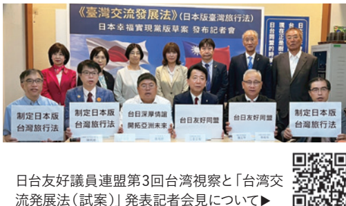
日台友好議員連盟第3回台湾視察と「台湾交流発展法(試案)」発表記者会見について▶